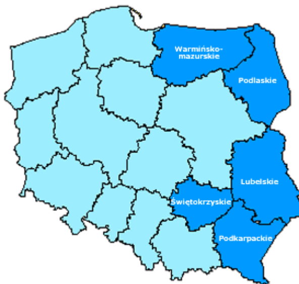
Województwa objęte programem Rozwój Polski Wschodniej

Cel ten nawiązuje do Programu Rządu „Solidarne Państwo” i wynika ze sformułowanych w perspektywie średniookresowej celów Strategii Rozwoju Kraju 2007 – 2015 oraz jest zgodny z celem NSRO 2007 – 2013, którym jest „Tworzenie warunków dla wzrostu konkurencyjności gospodarki polskiej opartej na wiedzy i przedsiębiorczości zapewniającej wzrost zatrudnienia oraz wzrost poziomu spójności społecznej, gospodarczej i przestrzennej.”